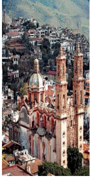
Templo de Santa

A qué periodo de la historia de México pertenece.