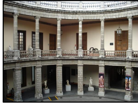
Patio del Palacio de los Condes de Buenavista, siglo XVIII

¿De las imágenes qué edificio es barroco?