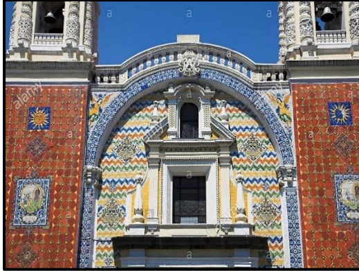
Santuario de Guadalupe (Puebla)

Enseguida observa las imágenes y responde lo que se plantea.